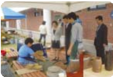
천연염색뿐만 아니라 규방공예, 도자기, 한지공예 등 다양하게 이루어진 체험활동