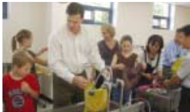
미국에서 방문한 3M 마이클 노만 대표이사 가족의 천연염색 체험