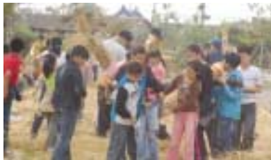
광주 신가초등학교 학생들의 천연염색과 하수아비 만들기 체험