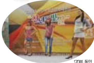
170분 동안 75벌의 천연염색의상을 선보였던 천연염색패션쇼