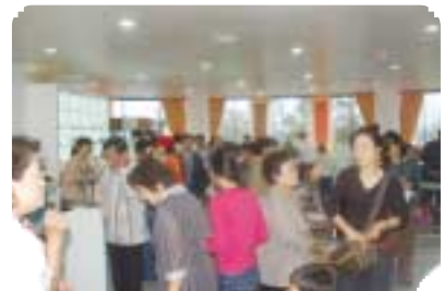
천연염색 쇼핑 명소가 된 나주시천연염색문화관 뮤지엄샵