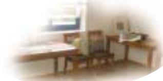
천연염색제품으로 장식된 나주시천연염색문화관 게스트 하우스의 식당