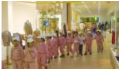
광주 동운어린이집 유치원 생들의 단체 관람

나주시천연염색문화관이 개관 이후 1일 평균 300여명의 관람객이 찾고 있다. 주로 광주광역시와 나주시 및 인근 함평군, 무안군 지역의 학생들하 MBC 대하 드라마 주몽 촬영지를 찾은 관광객들이 주를 이루고 있지만 언론매체에 노출빈도수가 높아짐에 따라 전국의 천연염색 전문가 및 일반인들의 방문이 증가하고 있다. 단체 및 가족단위의 체험도 증가하고 있어서 나주시천연염색문화관에서는 세분화된 체험 프로그램을 마련하고 있다.