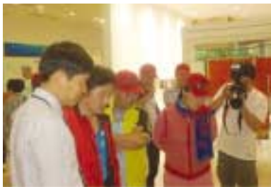
천연염색문화관 직원으로부터 전시물에 대한 설명을 듣고 있는 한나라당 원희룡 최고의원 (왼쪽에서 두 번째)

한나라당 원희룡 최고 의원은 10월 1일 나주시영산강마라톤 대회 참석차 나주시를 방문하여 마라톤 대회를 마치고, 나주시천연염색문화관을 방문하였다. 원희룡을 사랑하는 광주전남지역 모임의 회원들과 함께 천연염색문화관을 방문한 원희룡 최고 의원은 전시물의 관람, 천연염색문화관 직원들과 간담회 등을 마치고