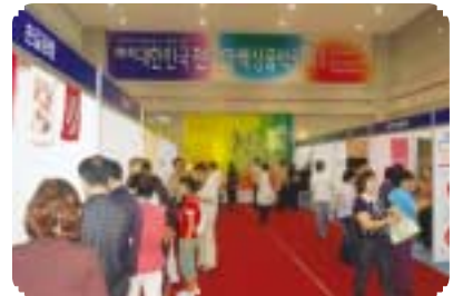
일반인들에게도 다양한 볼거리와 쇼핑의 기회를 제공한 천연염색상품박람회