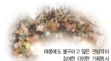
태풍에도 불구하고 많은 관람객이 참여한 다양한 기획행사