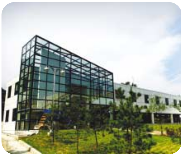
나주시천연염색문화관 체험동 전경

화관의 운영시스템은 아래와 같이 국내에서 처음 시도되는 재료구입에서 완제품 제작까지 한 곳에서 이루어지는 원스톱 체제여서 전문가는 물론 일반인들에게도 많은 관심을 끌 수 있을 것으로 기대된다.