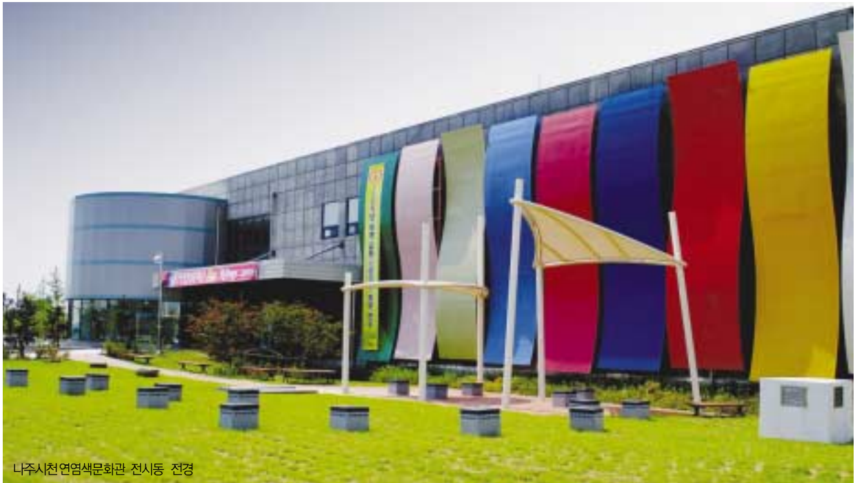
나주시천연염색문화관 전시동 전경