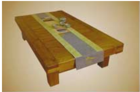
풀빛 김왕식 대표의 기증품